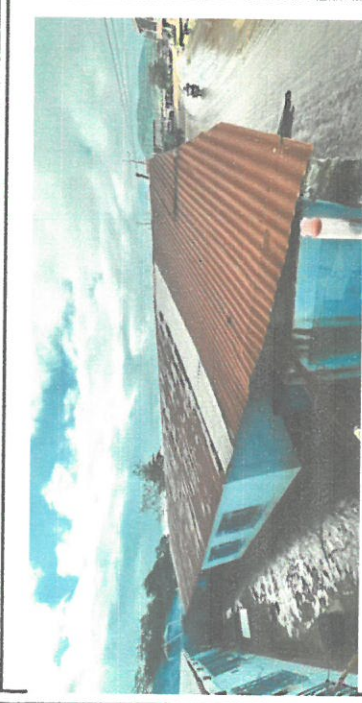
Foto1: Mejoramiento de Techo.